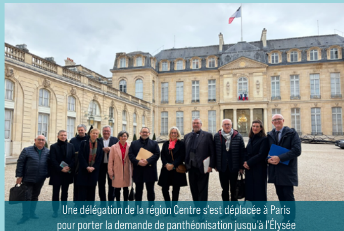
Une délégation de la région Centre s'est déplacée à Paris pour porter la demande de panthéonisation jusqu'à l'Élysée

Si l'œuvre de George Sand est ancrée dans son siècle, elle entre aujourd'hui en résonance avec des préoccupations contemporaines. Ses écrits témoignent d'une attention particulière à la nature, au monde rural et aux équilibres sociaux. Elle questionne également la place des femmes dans la société, dénonçant les inégalités juridiques et sociales. Autant de thématiques qui trouvent un écho direct dans les débats actuels.