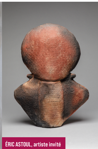
ÉRIC ASTOUL, artiste invité